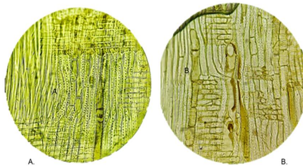
Figura 2. Corte Radial: A) 100X. Ponteadoras areoladas simples, raios homogêneos B) 100X. Presença de óleos nos elementos de vaso.