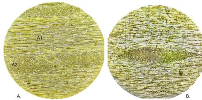
Figura 1. Corte tangencial: A) 40X. A1. Raios uni seriados. A2) Raios agregados B) 40X. Raios multisseriados.