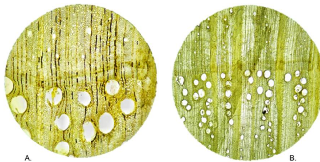
Figura 3. Corte transversal: A) 40X. Porosidade anular y anel de crescimento. B) 40X. Diferencias de anéis.